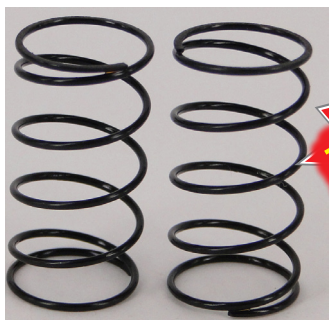
DL054 MSF スプリング (全長29mm)