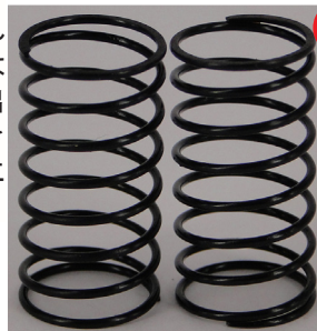
DL174 MSR ロングスプリング (全長31mm)