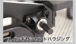
メインギヤシャフトハウジング